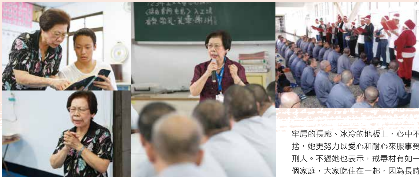
▲常為吸毒者和受刑人禱告

有時氣到想放棄他們，但當我哭泣又禱告後，就有力量，有時短短的禁食禱告，神就給我亮光。」