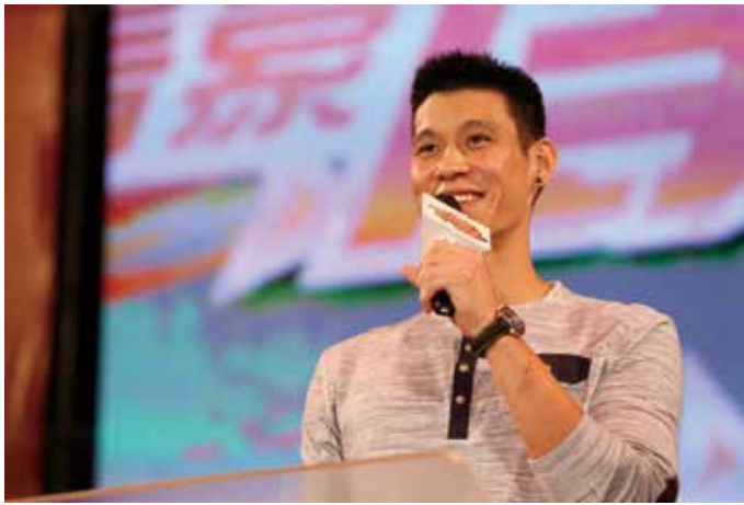
▲今年的「林書豪青年之夜」，嘗試對外開放索票。