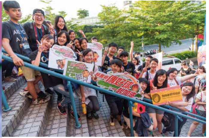
▲年輕族群是 GOOD TV 接下來要爭取的對象。