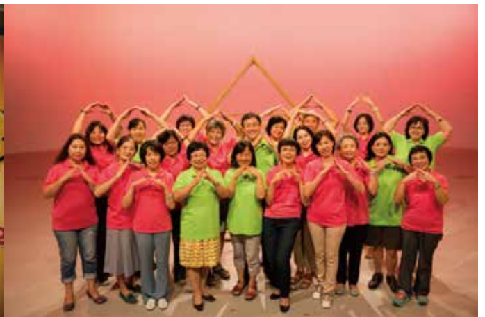
▲好消息「家庭關懷專線」的志工群，已轉介超過 250 名觀眾進入教會。