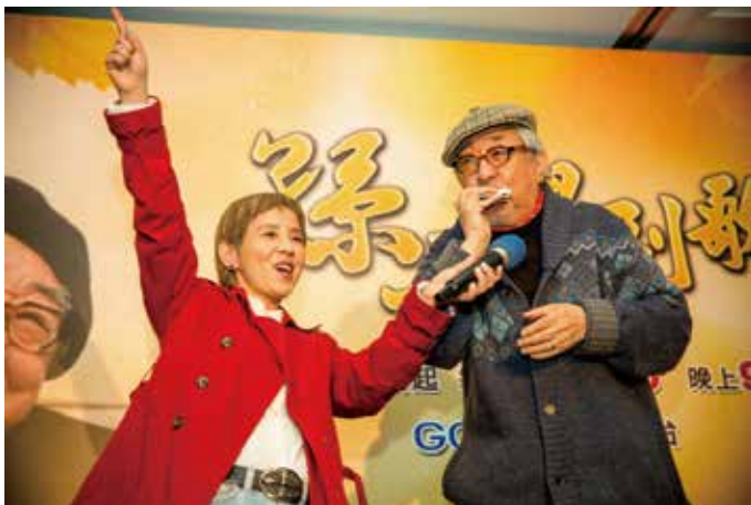
▲《孫叔唱副歌》是針對銀髮族開關的節目。

兩年來，來電總數超過兩萬通，多數透過電話傾聽陪伴得到關懷與幫助。轉介服務方面，目前有兩百多間教會加入「夥伴教會」，已轉介超過 250 位非信徒觀眾接受實際的接觸關懷，並且超過七成穩定加入教會。今年九月，「中彰