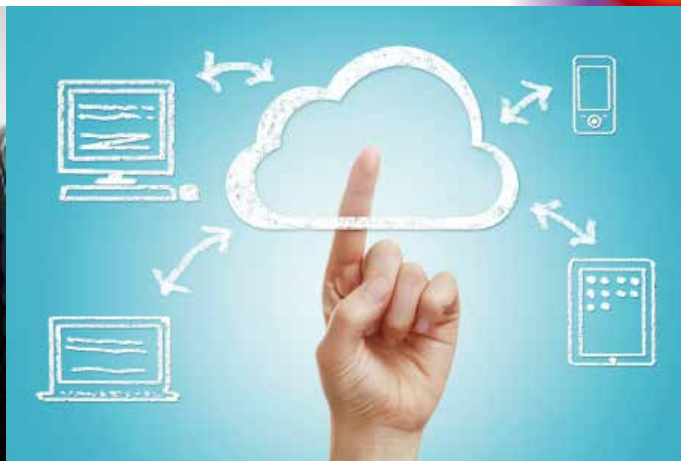
▲ GOOD TV 始終不忘記傳福音的使命，全力打造福音平台。

投地區第一屆家庭宣教夥伴教會培訓」即將展開，八月中已接到台南教會的邀約，預計繼中彰投培訓後，將首度進軍府城，另外，預備建立各區家庭教會工作坊，將關懷資源網絡化，一同增進專業服務能力，超宗派聯手家庭宣教，學習非信徒牧養操兵，預見復興。另外，編寫家庭教材的工作已經啟動，預計明年元月起陸續推出，敬請拭目以待，也請迫切為集合眾多家庭專家，全方位的家庭教育服務代禱。