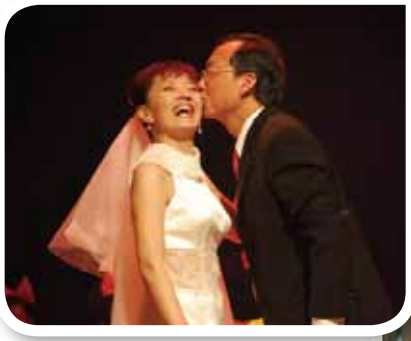
和太太鶼鶼情深，尤其在太太抗癌期間，天天下廚預備健康營養的餐點。