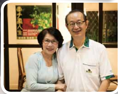
▲多年來，太太一直是楊院長最大的支持後盾。

氣罩呼吸，他說：「那陣子我每一口氣呼出去，都不知道下一口氣能否進得來？」另一次裝了人工血管後，也是因免疫力過低，細菌感染引發敗血症，護士量不到血壓，總醫師也因看見病人是院長有點驚慌，楊院長說：「當時所有醫療的程序變成我自己來下指令。太太也急著問我是否要走了？我告訴她到一旁禱告，後來主治醫師來，用過藥物後我才穩定，那是我最近生命終點的一刻。」